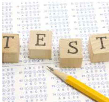
Test di verifica apprendimento