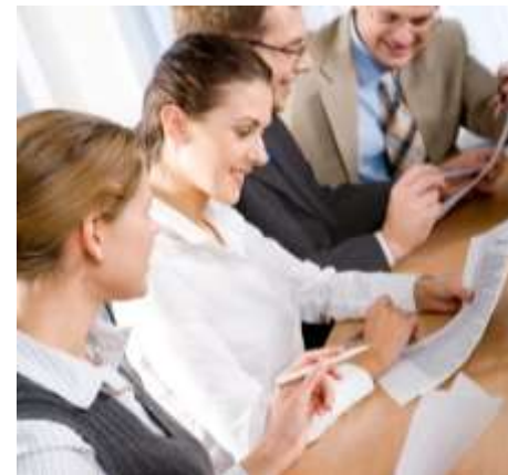
Test di gradimento