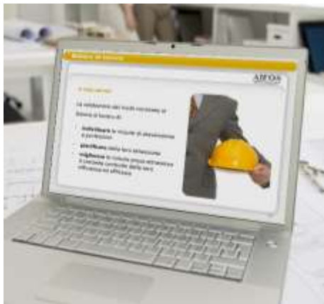
Formazione specifica lavoratori: autoveicoli